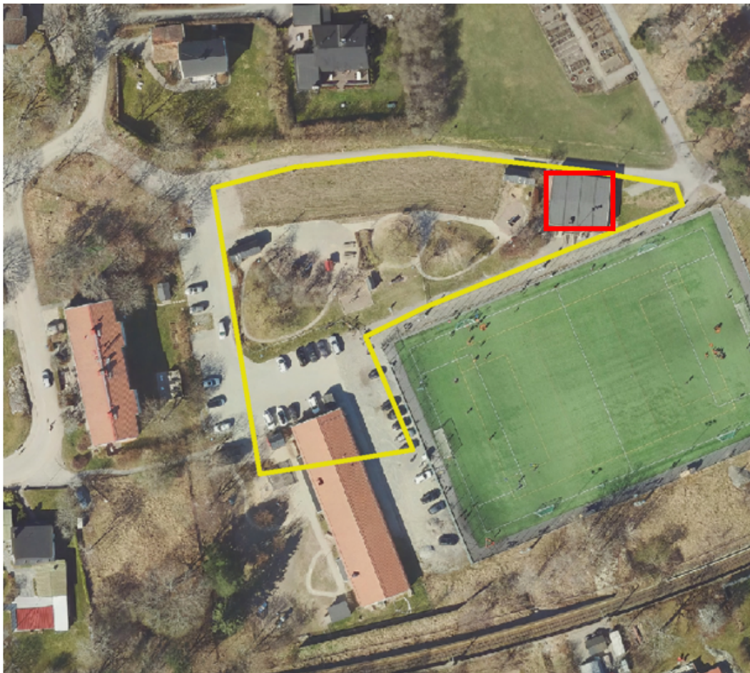
Figur 1 Tävlingsområdet markerat med gult. Avetablerad paviljong markerad med rött.