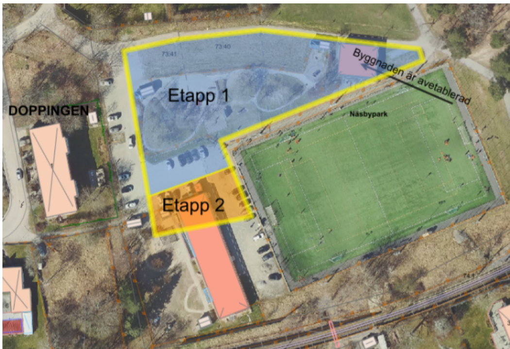
Figur 3 Etappindelning fastighetsbildning

Etapp 1 innebar att Näsbypark 73:40 tillfördes mark så att den blir cirka 3 504 kvadratmeter. Etappen är genomförd.